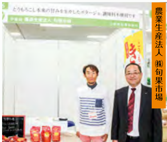
農業生産法人(株)旬果市場