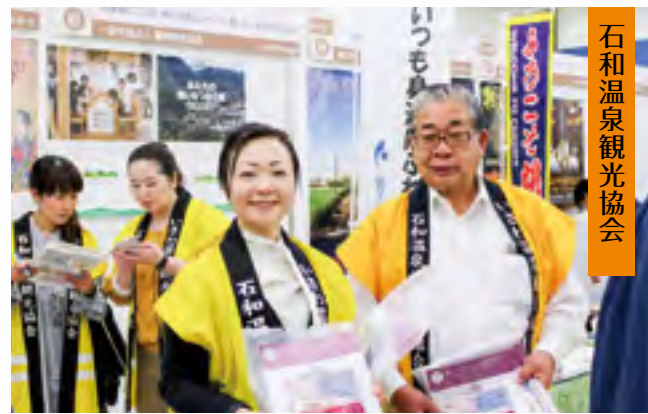
【出展企業】 (食の商談会) 中央物産株式会社、長谷川醸造株式会社、農業生産法人(株)旬果市場 (観光ブース) 石和温泉観光協会