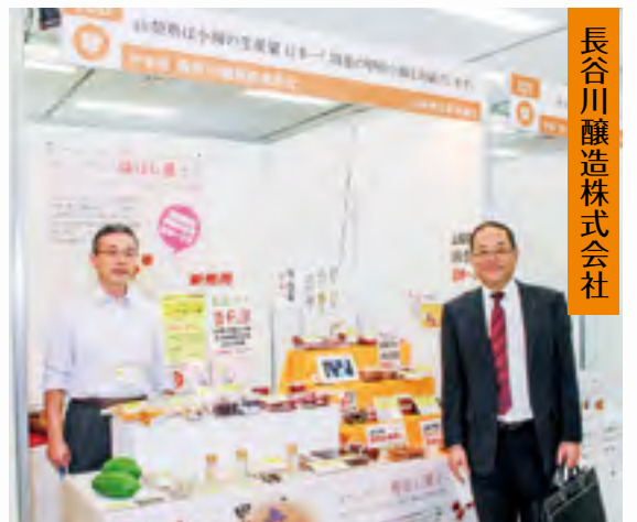
長谷川醸造株式会社