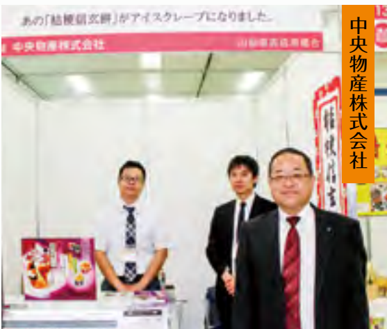
中央物産株式会社