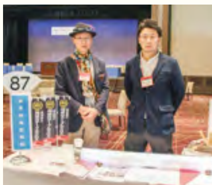
金長特殊製紙 株式会社 【和紙テーブルクロス】