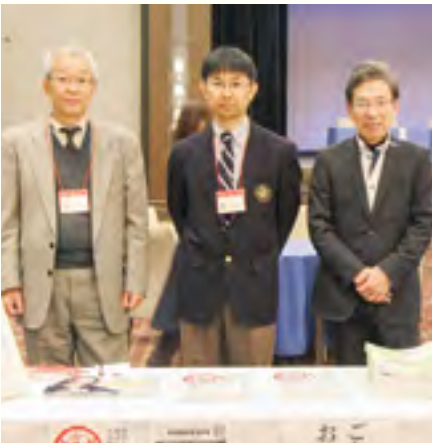
山梨県よろず支援拠点の皆様