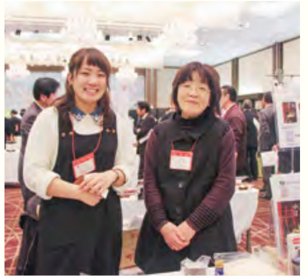
ゆば工房五大【角ゆば等】