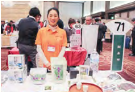
株式会社 桑郷【桑荒茶、桑パウダー原料、 龍神桑茶、毎日飲みたい桑の葉茶】