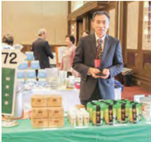
株式会社 菱和園【日本茶・抹茶】