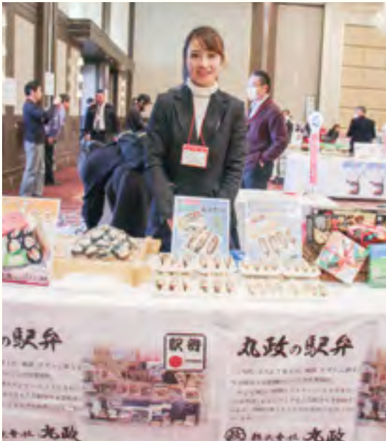
株式会社 丸政【天むす・清里高原かつサンド】