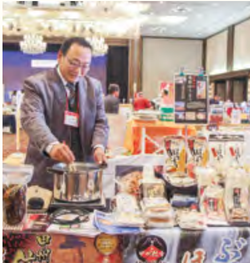
有限会社 横内製麺【山梨県産小麦粉 100%使用「甲州信玄ほうとう」】