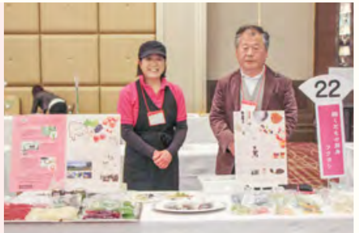
株式会社くだもの厨房フクヨシ 【フルーツピュレ、シロップ漬け、ドライフルーツ】