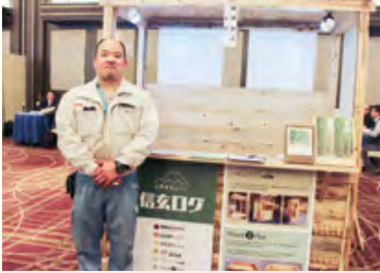
山静商会 株式会社 【山梨県産木材を使ったログハウス、ミニハウス】