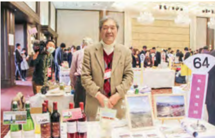
敷島醸造 株式会社 【ワイン(マウントワイン、デラウェア)】