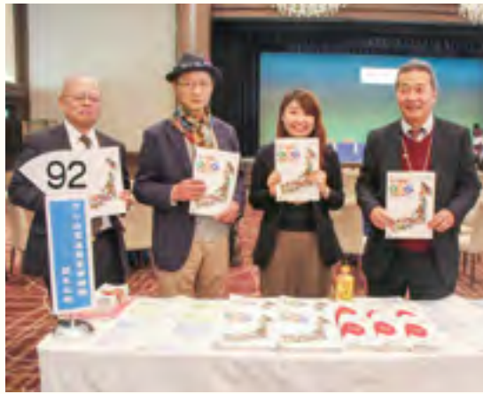
中小企業基盤整備機構のブース