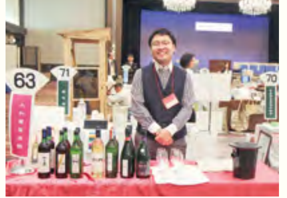
大和葡萄酒 株式会社 【スパークリングワイン「ハギースパーク重畳」】