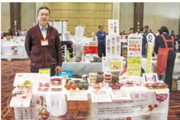
長谷川醸造 株式会社 【信玄小梅ぼし昆布漬、昔ながらの小梅ぼししそ漬等】