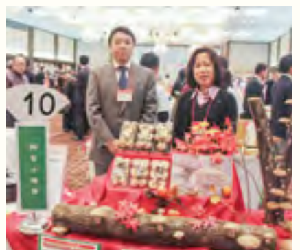
株式会社 富士種菌 【原木しいたけ栽培セット「きのこ狩り」、原木生しいたけ】