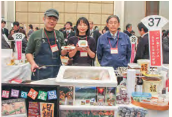
一般財団法人 南アルプスふるさと活性化財団 【フジザクラポークの手作りバラベーコン、白鳳味噌等】