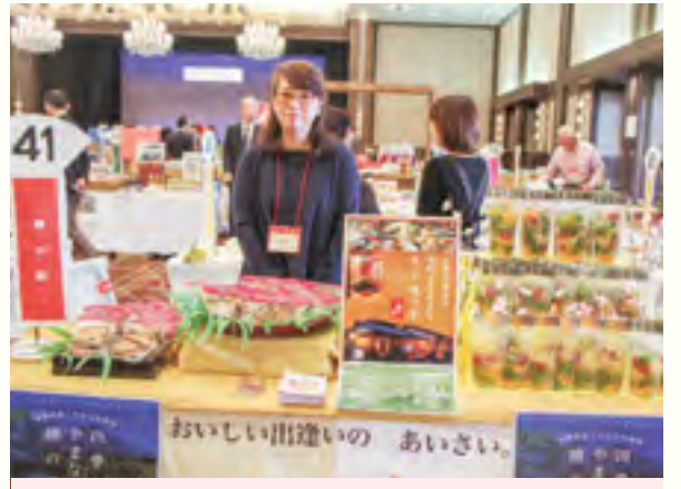
勝の家 逢い菜ものがたり 【青梅のフルーツシロップ漬け、鶏の味噌漬炭火焼等】