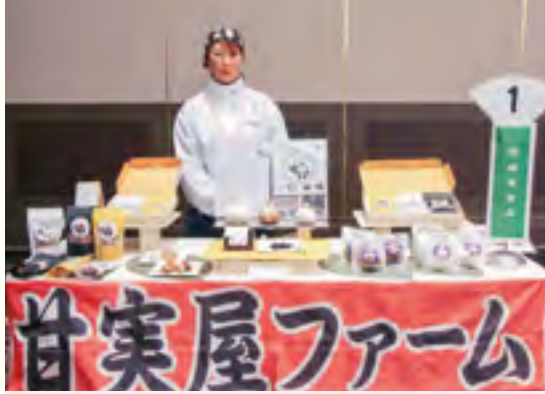
有限会社 映東食品 【ジャンボにんにく「じゃんぼ富士丸くん」】