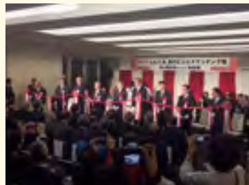
「しんくみ食のビジネスマッチング展」 開会式