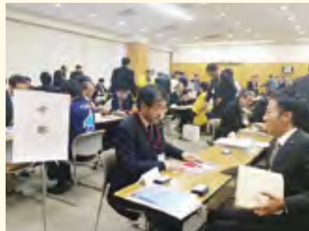
「年金旅行ビジネス交流会」相談対応の様様

12月3日、笛吹市スコリーセンターにおいて開催された、山梨県中小企業団体中央会・やまなし6次産業化サポートセンター主催の「6次産業化個別相談会」に出展し、融資相談等に対応しました。