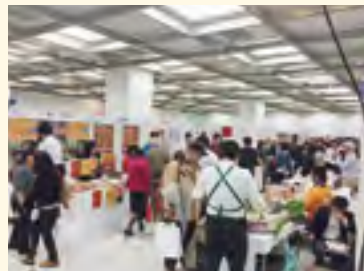
「しんくみ食のビジネスマッチング展」 物産展の様様