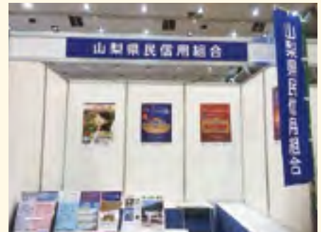
「山梨テクノロジーICTメッセ」出展