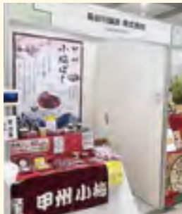
「食のビジネスマッチング展」 食の商談会出展企業 (長谷川醸造株式会社)