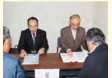
「6次産業化個別相談会」相談風景