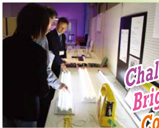
節電の時代、LEDも人気でした