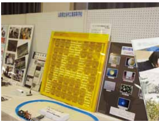
今回は谷村工業高校の生徒も参加