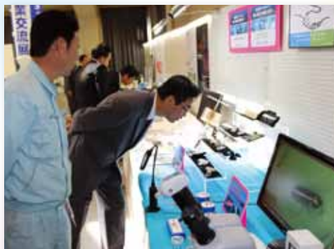
顕微鏡を使っての微細の技術に見学者も感心